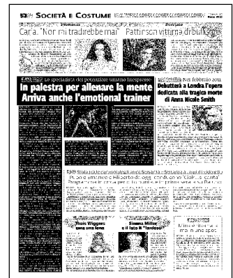
Ritaglio stampa ad uso esclusivo del destinatario, non riproducibile.